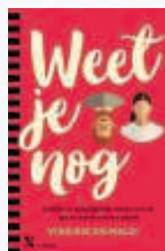
Weet je nog (Xander, €20)