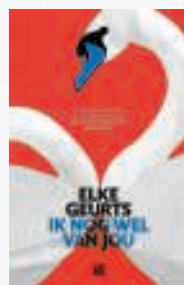
Ik nog wel van jou (Lebowski, €20)

Drie boeken waaruit wellicht troost te putten valt in geval van hartbreuk, en wie weet wel een vingerwijzing voor hoe je dat doet, een gebroken hart ontbreken. ■