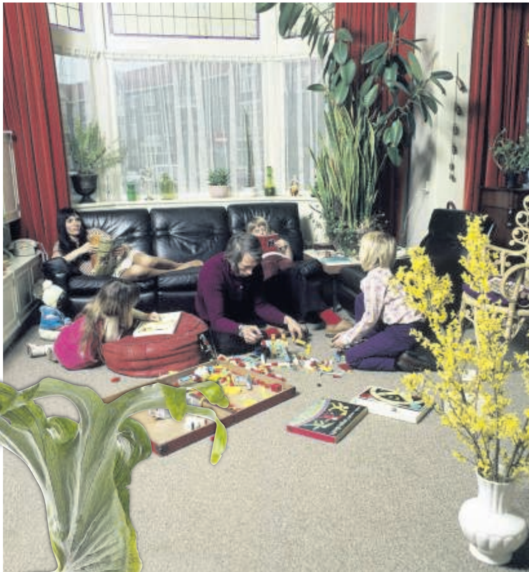
▲ De jaren '70 waren hét kamerplantentijdperk. De krulvaren en de sansevieria zijn tegenwoordig weer reuze populair.

Sansevieria's die netjes rechtop in het gelid in de vensterbank stonden, gatenplanten, vingerplanten, anthuriums, cactussen en vetplanten: van ouderwets via camp tot trendy. Ook planten die niet per se heel fraai zijn om te zien, zoals de hertshoorn, zijn weer volop verkrijgbaar. En eveneens voorzichtig begonnen aan een opmars is de erwtenplant met zijn lange slingers van groene balletjes. Niet zo gek, want als het interieur is geïnspireerd op de jaren '70, dan de plantenpotten ook. En in de jaren '70 werden die opgehangen, in macramé geknoopte hangers met een kwast of een grote houten kraal aan de onderkant. Cisca, al jaren medewerkster van Intratuin in Amsterdam-Oost, kan het bevestigen, want zij ziet ze aan de kassa allemaal voorbij komen. „Veel cactussen en vetplantjes. En wat ook weer in schijnt te zijn, is