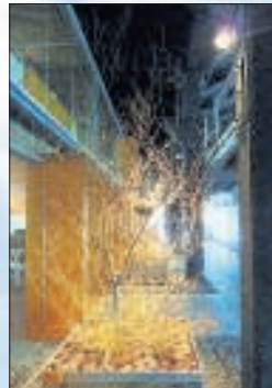
Nestboom: Binnen in het vogelcentrum.

Behalve aalscholvers krijgen de mannen van het binnenkort te openen vogelcentrum Urdaibai in Spaans Baskenland nog meer bezoek uit Nederland. Lepelaars die in de zomer op Terschelling en Vlieland bivakkeren, en andere waadvogels benen door het brakke water waarin tientallen meerkoe-ten dobberen. Er zwemmen futen, dodaarzen en eendensorten als de taling en de wilde eend. Ook de smient is een veelgeziene winter-gast.