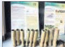
Droog: Kaplaarzen voor onderzoekers.

Het is de vraag of dat volgend jaar ook nog zo is. In de nieuwe Natuurwet van staatssecretaris van Landbouw, Henk Bleker, verliezen trekvogels hun beschermde status en mogen ze dus worden bejaagd.