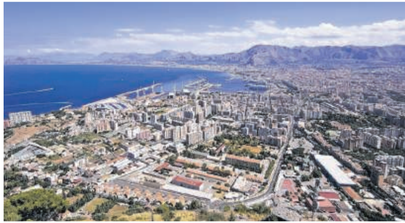
Overzicht: De stad is prachtig gelegen tussen de bergen en de baai.