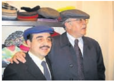
Opa's: Maffiapetje? Welnee, bij La Coppola Storta verkopen ze petjes voor hardwerkende Sicilianen.